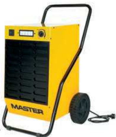
DH 44 DH 62 DH 92