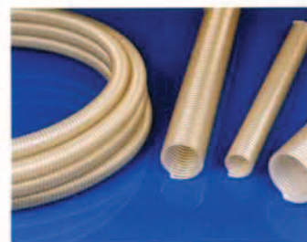
Master-PUR HX-S PU elszívó- és szállítótömlő, nagyon kopás- és vákuumálló, nagyon sima belső felülettel