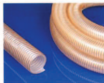
Cargoflex PU szívó- és szállítótömlő, ülönösen kopás- és vákuumálló.