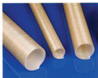
Master-PUR HX PU elszívó- és szállítótömlő, különösen kopás- és vákuumálló, spirál alatt megerősítve.