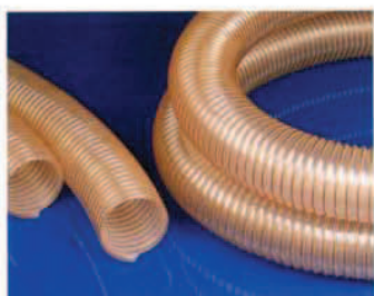
Master-PUR HÜ PU elszívó- és szállítótömlő, közepes kivitel / erősített