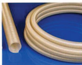
Master-PUR SH PU szívó- és szállítótömlő, fokozottan vákuum- és kopásálló